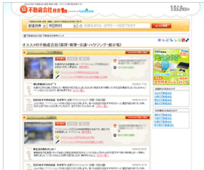
「超不動産会社検索」トップページ http://chofud.jp/

日本最大級の地域コミュニティサイト「Lococom(ロココム)」(以下、「Lococom」)を運営する株式会社ネクスト(本社:東京都中央区、代表取締役社長:井上高志、東証第一部:2120)は、2010年6月3日より、「超検索」シリーズ第6弾の不動産会社情報の検索に特化したサイト「超不動産会社検索」を開始いたしました。