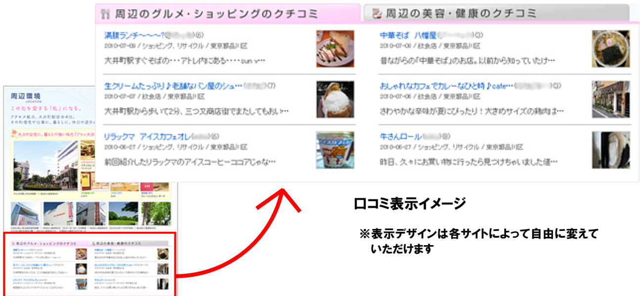
ルジエンテ大井町ウェブサイト

また、「Lococom」のロコミは、ユーザーが他のユーザーと共有したいと思った情報を自発的に投稿したものです。そのため、生活者の目線からみた大井町周辺地域のリアルな姿を知るのに最適といえます。東急リバブル株式会社にとっては、物件情報のみならず物件を探す際に気になる周辺情報にロコミという地域情報が加わることで、マンション購入検討者が購入後の生活をより具体的に想像する際の手助けになります。