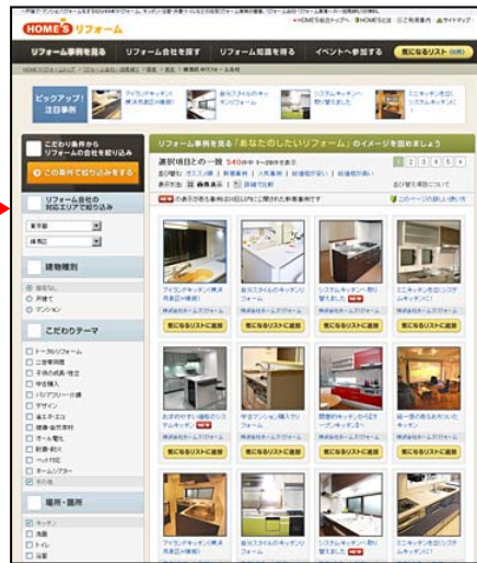
リフォーム事例一覧