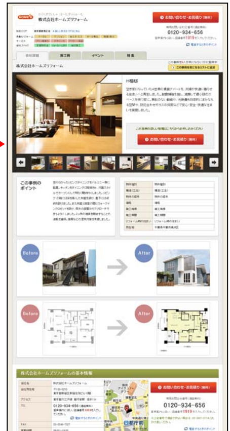
リフォーム事例詳細