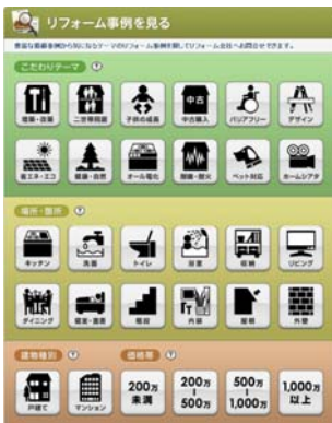
リフォーム事例アイコン