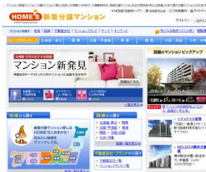
【HOME'S新築分譲マンション】