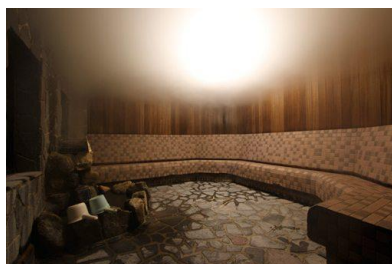
大谷田温泉 明神の湯