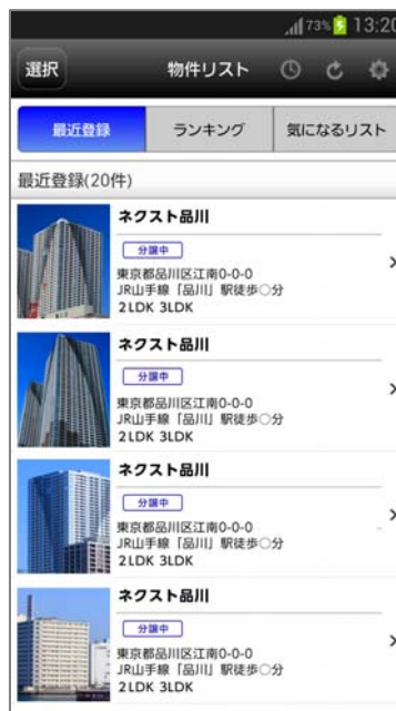
【物件リスト「最近登録」画面】