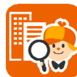
【新着物件ナビ アイコン】

URL: https://play.google.com/store/apps/details?id=jp.co.homes.android.ShinchikuNewArrival