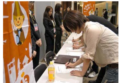
【2009年9月開催 不動産投資フェアの会場風景】