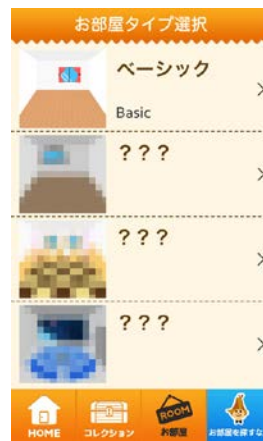
【お部屋タイプ選択画面】