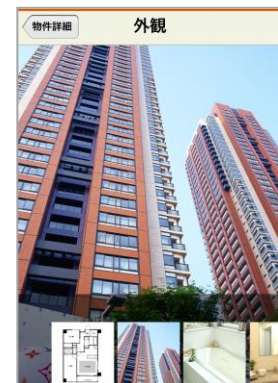
【物件詳細(画像)画面】