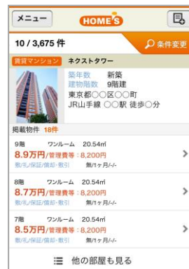
【検索結果画面(物件まとめ表示の例)】