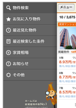
【ナビゲーション画面】