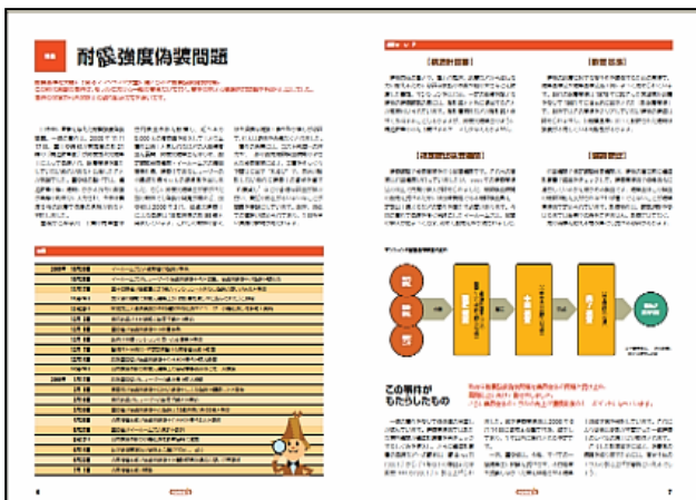
【特集：耐震強度偽装問題】