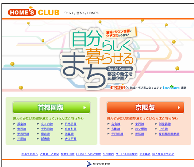
特集トップページ

そこで「HOME'S」では、リサーチの結果から判明した、首都圏・京阪の地下鉄路線で、住みたい駅人気ランキング上位3位までを中心とした駅を網羅して、駅周辺の家賃相場、生活情報、現在住んでいる先輩からの口コミアドバイスなどを組みあわせ、納得のいく住まい探しに役立ていただく特集ページを企画いたしました。