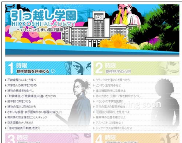
【引っ越し学園 トップページ】

http://realestate.homes.co.jp/contents/hikkoshigakuen/