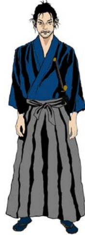
【1時限の講師】サムライ

各時限ごとに個性ある講師(右絵の“サムライ”など)が担当し、4時限すべてが終了するまでに4人の講師が登場します。今後は月に1時限ずつ公開し、2007年4月に全ての時限のリリースが完了いたします。