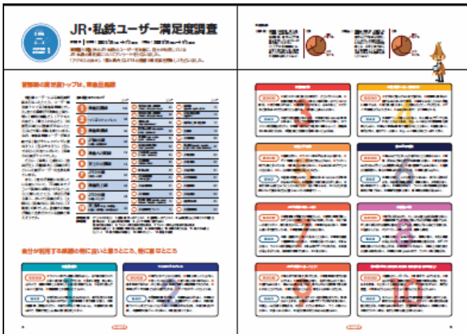
〈JR・私鉄ユーザー満足度調査〉