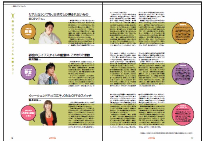
〈多様化するライフスタイル〉