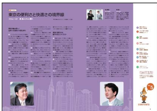
〈東京の便利さと快適さの境界線〉 巻頭インタビュー コラムニスト 泉麻人氏