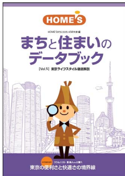
『HOME'S まちと住まいのデータブック【Vol.5】 東京ライフスタイル徹底解剖』 〈HOME'Sまちと住まいの研究室〉編

住宅・不動産情報ポータルサイト「HOME'S」を運営する株式会社ネクスト(本社:東京都中央区、代表取締役社長:井上 高志、東証マザーズ:2120)は、このたび、2007年10月から2008年3月に実施した「まち」と「住まい」に関する意識調査ならびに不動産業界動向などをまとめた冊子、『HOME'S まちと住まいのデータブック【Vol.5】東京ライフスタイル徹底解剖』(非売品)を発行いたしました。今回もご希望の方、先着300名様にプレゼントいたします。(お申し込みは専用WEBページ経由のみとさせていただきます)。