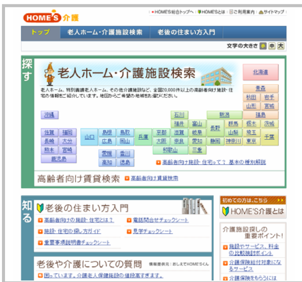
HOME'S介護 トップページ

HOME'S介護では情報量の拡充に努め、2009年3月末までには有料掲載の施設数を200件までに増やす計画です。また、中長期的にはマーケットの半数の情報を掲載する規模にしていく予定です。