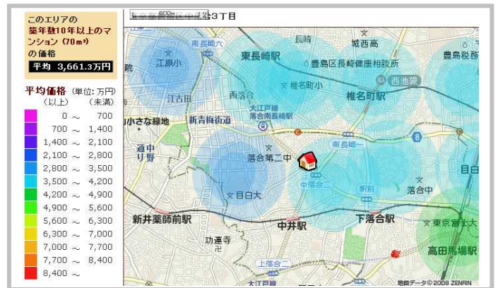
相場価格情報の表示例