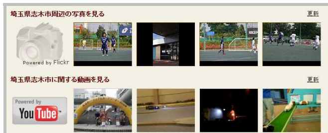
周辺エリアの動画・写真の表示例