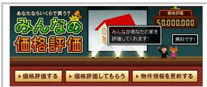
みんなの価格評価ページ

本サービスにより、情報を掲載するユーザーは不動産会社に査定を依頼することなく、自分の不動産の価格を調べることができます。また、自身が所有している不動産の適正価格を知ることで満足度を得られるほか、売却価格のシミュレーションを行うことも可能です。