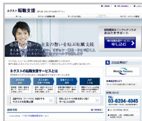
「ネクスト転職支援」トップページ