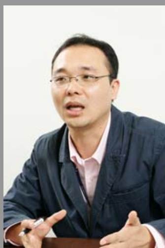
株式会社ネクスト 金 相集