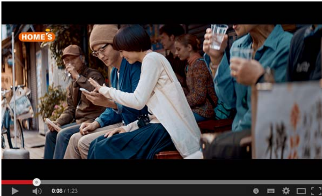
【この街に住みたい篇】

見て！答えて！当てようTVCMキャンペーン URL: http://promo.homes.co.jp/cp/2015_tvcm