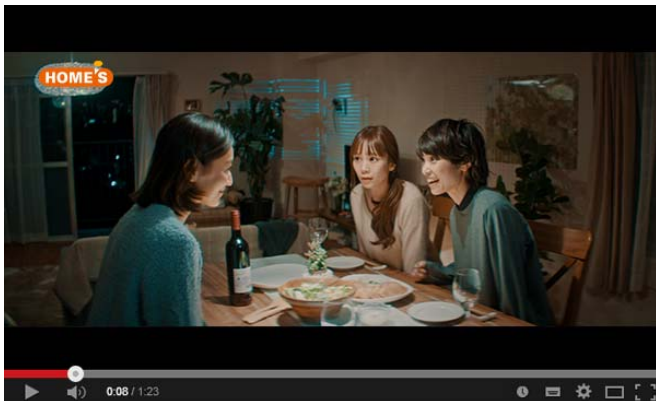
【ここに住みたい篇】

久しぶりに集まった大学の同期。それぞれ会社は違えど忙しそう。 少しでも寝たいから会社のそばに引っ越したいだって？わかるわ、その気持ち。 ただ、住まい探しの時間すら無いよね俺たち・・・